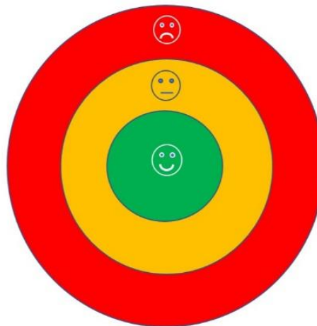
Beispiel des Ergänzungsmaterials 3-4 Jährige: Dreistufiger PEAP Teich

Beide Varianten des PEAP 2.5 können zusammen mit der Buchung eines jeweiligen PEAP-Kurses bestellt werden. Möglich ist auch die Bestellung beider Varianten ohne Kursteilnahme.